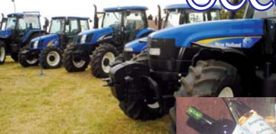
Maquinaria e comercial